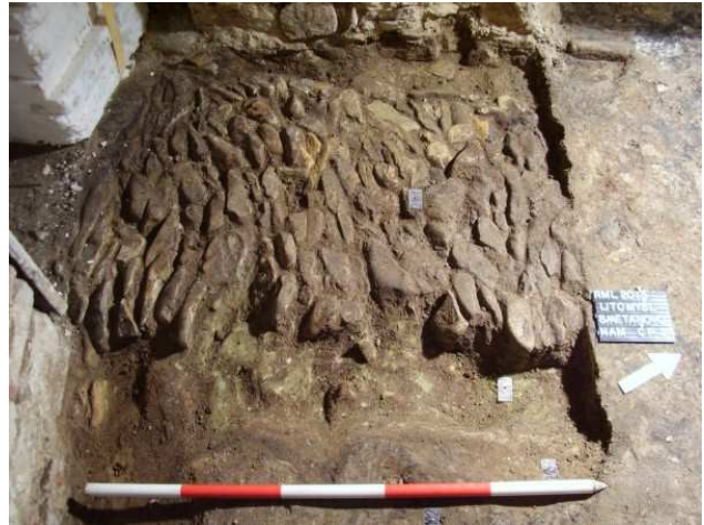
Obr. 5 z drobných oblázků, která částečně zůstane v prostoru zachována ( obr. 6 ). Obr. 6 Z domu také pochází keramický materiál z období renesance.