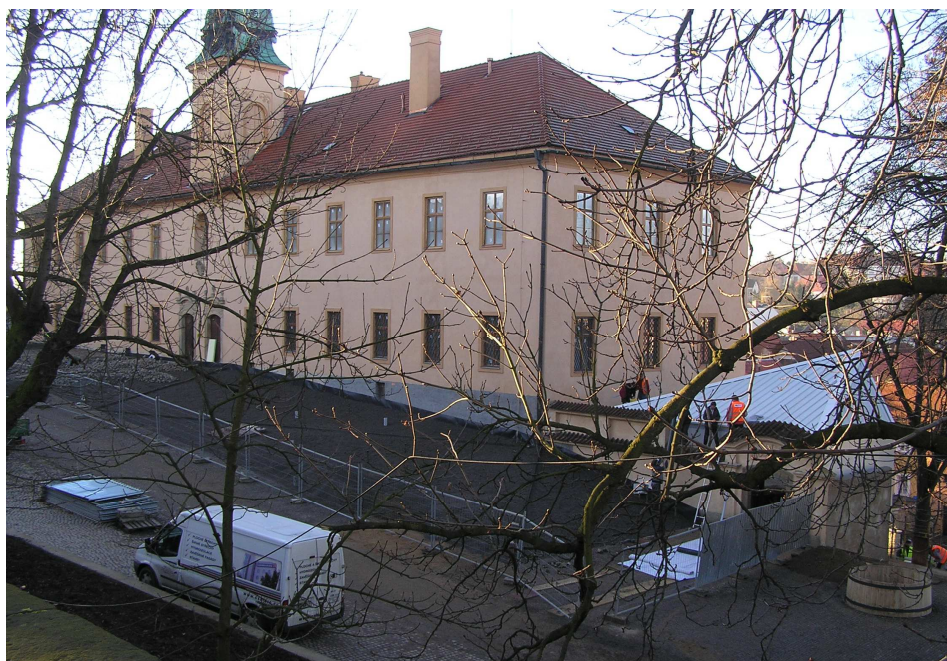
Vlevo suterénní ochranný objekt nad archeologickými nálezy, vpravo střecha budoucího vstupního foyer. 16. 12. 2013

Před muzeem směrem k zámku vyrostl ochranný suterénní objekt pro archeologicky odkryté pozůstatky horního města. V současné době se pracuje na finální podobě jeho exteriéru – horní plocha (střecha) je zasypána štěrkem a začíná se s jeho zadlážděním.