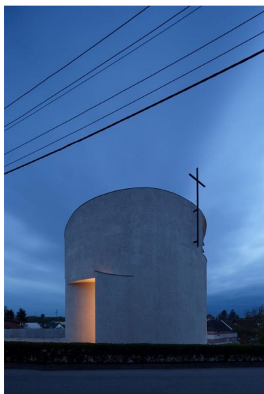
Kostel sv. Václava v Sazovicích