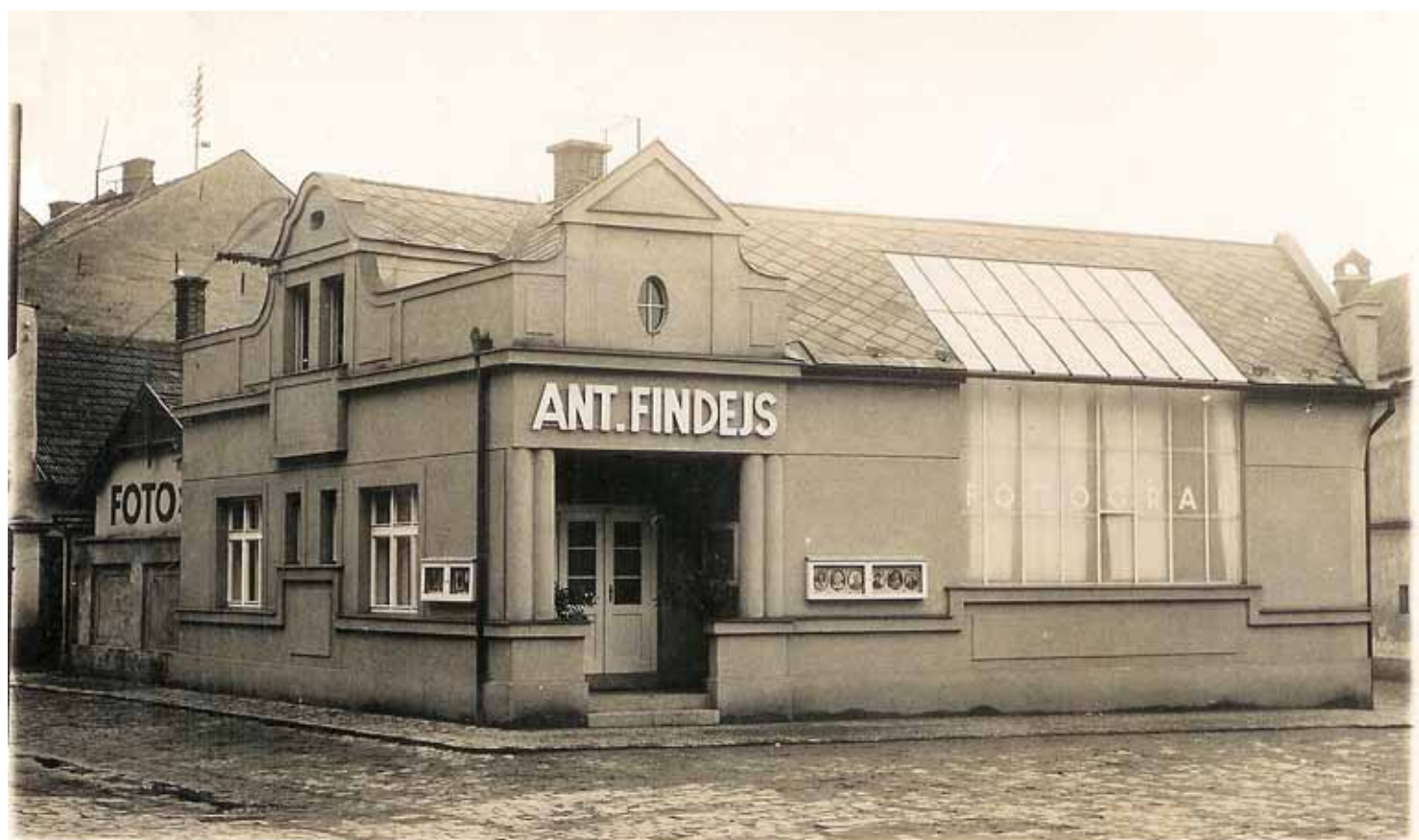
V domě čp. 154 na Šantově náměstí sídlil fotograf Antonín Findejs (foto kolem roku 1935). Dnes je zde knihárství.

S vydáváním brzy začaly další zdejší firmy – Faltysovo knihkupectví, Augustova tiskárna nebo Dmychova tiskárna. Zájemci o pohlednice z venkova, zejména majitelé vesnických hostinců, si pohlednice mnohdy nechávali zhotovit u litomyšlských fotografů – nejčastěji ve fotoateliérech Ludvík, Tachezy, Findejs nebo Mikeš. Pohlednice pak sloužily k propagaci jejich živností.