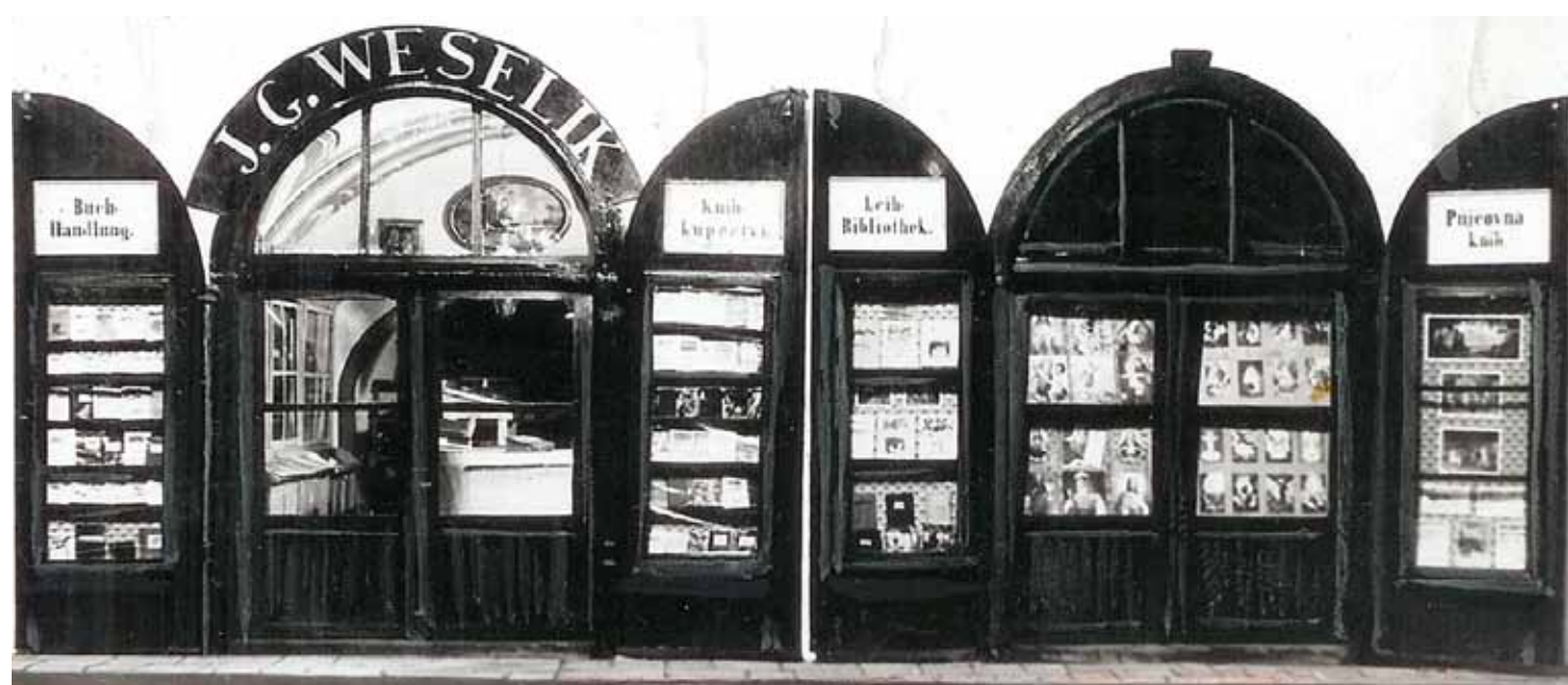
Veselíkovo knihkupectví v letech krátce po založení.