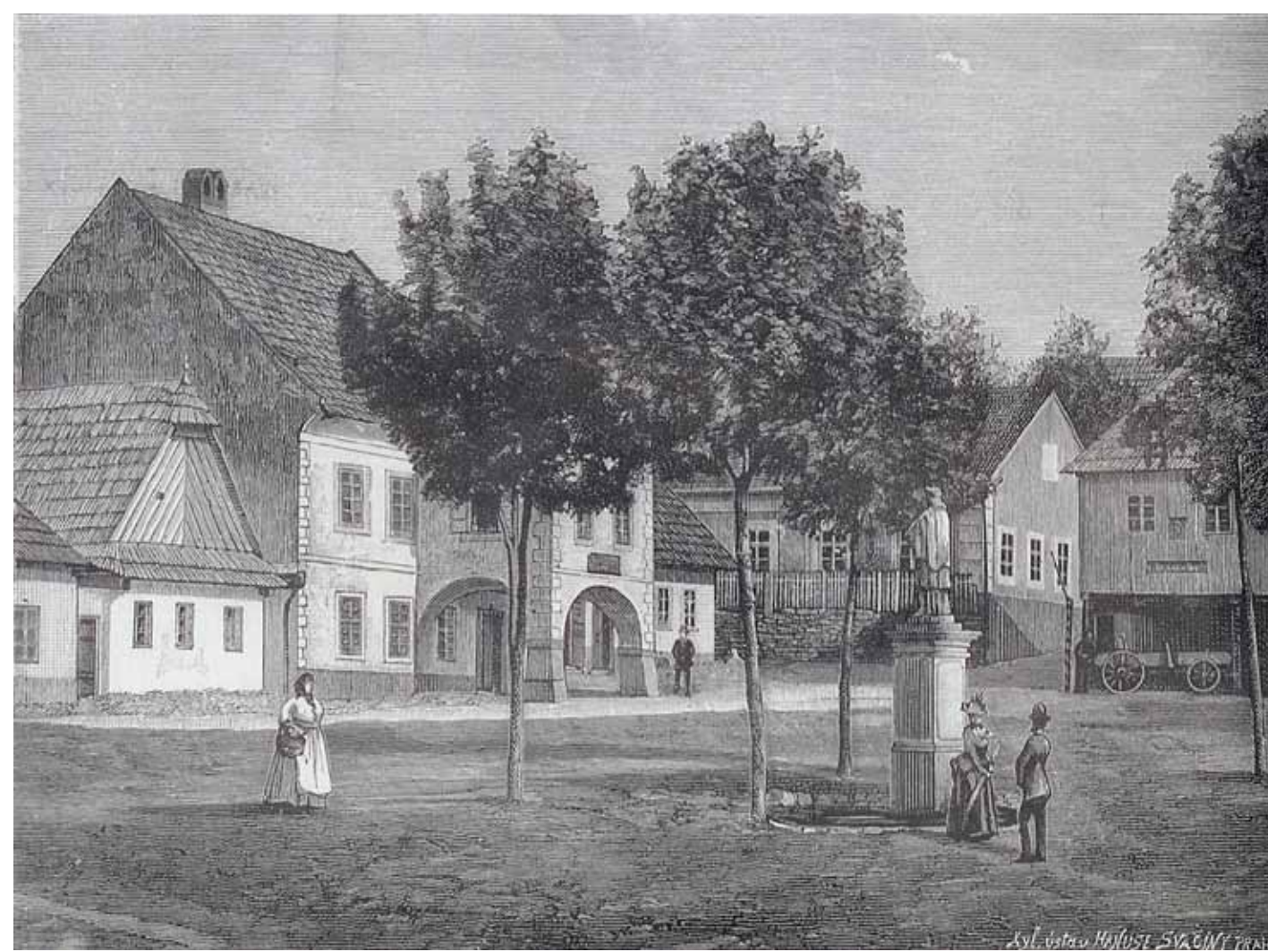
Dřevoryt Hanuše Svačiny – Záhradské předměstí v Litomyšli (1888) – ze sady vydané Veselíkovým knihkupectvím. Šlo v podstatě o upomínkové obrázky – předchůdce pohlednic.

Německé obyvatelstvo okresu služeb českých vydavatelů nevyužívalo, a tak pohlednice z těchto obcí z velké části vznikaly ve Svitavách nebo Moravské Třebové.