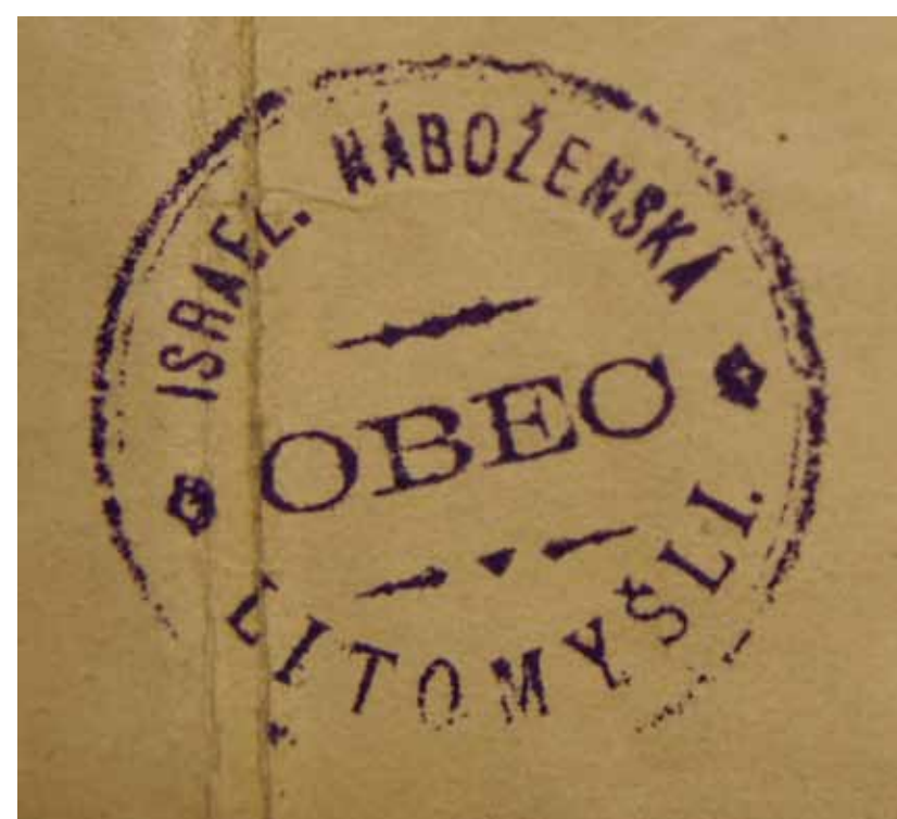
Razítko Israelitické náboženské obce v Litomyšli

Obec měla synagogu, dokončenou roku 1910, užívala židovský hřbitov a v jejím čele stál rabín. Náboženský život obce byl vcelku umírněný a týkal se především starší generace. V průběhu první poloviny 20. století v mnoha židovských rodinách postupně docházelo k oslavám svátků jak židovských, tak i křesťanských. Členové místní komunity, podporující prvního československého prezidenta T. G. Masaryka, se také aktivně účastnili všelikých oslav národního rázu.