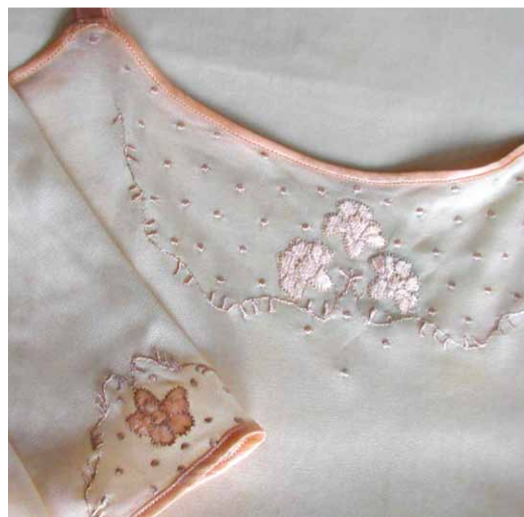
☛ Ručně vyšíváné prádlo firmy Linka repro ze sborníku Zmizelí sousedé

Na rozdíl od jiných míst nebyli litomyšlská Židé koncentrováni v jedné konkrétní městské části. Nejvíce jich od poloviny 19. století obývalo domy na náměstí, kde zároveň často provozovali obchody. Další bydleli v blízkosti synagogy. V obou lokalitách ovšem žilo židovské i nežidovské obyvatelstvo společně. Na přiloženém plánu jsou vyznačeny domy obývané židovskými obyvateli Litomyšle (stav z r. 1921).