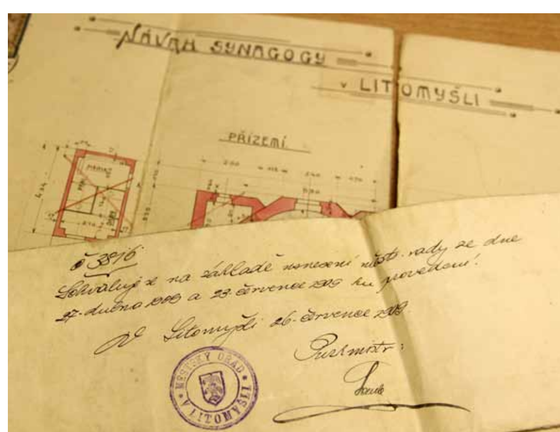
Schválení stavby synagogy SOKA Litomyšl