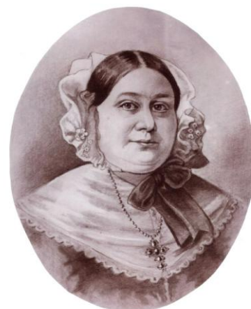
Magdalena Dobromila Rettigová, podobenka z r. 1840.